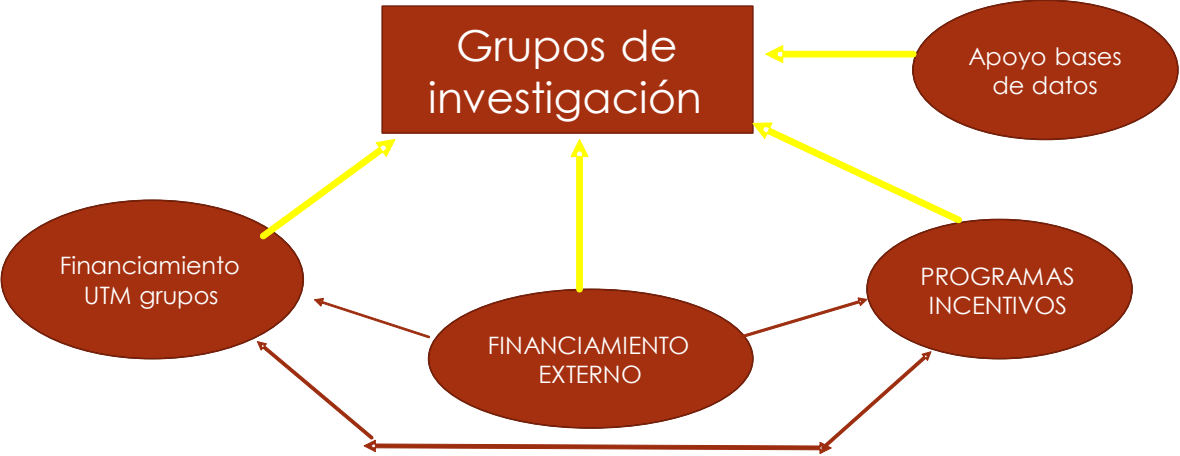
Figura 2: Estrategia para consolidar los grupos que incluye el apoyo financiero de la UTM, consolidación de fuentes de financiamiento externo, creación de programas de incentivos y establecer la base datos accesible a los investigadores.

La primera tarea que se requiere realizar es proveer el ambiente y la estabilidad idóneas para realizar investigación. Para ello, la Dirección de Investigación tiene como marco conceptual lo plasmado en la figura 2, que se resume en asignar un presupuesto, desde la UTM, para el fomento de los proyectos de investigación presentados por los grupos de investigación. Este esfuerzo institucional ha de ir acompañado de la consolidación de apoyos externos, lo que equivale a encaminarse a mostrar al sector externo que los proyectos de la UTM son competitivos. Paralelamente, se aspira a concurrir a proyectos internacionales con el propósito de crear redes de trabajo y de investigación. Es igualmente importante la creación de programas de apoyo a la investigación, y prioritario, en 2018, tener fuentes de documentación accesible al profesorado. A continuación se detalla lo planificado: