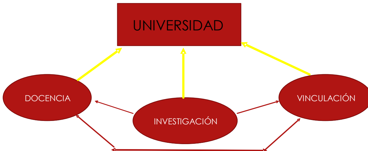
FIGURA 1: Esquema que muestra las actividades propias universitarias en las cuales basa su funcionamiento. Existen otras actividades de funcionamiento y servicio que apoyan estas tres actividades fundamentales.