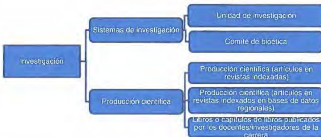
Figura 8: Criterio Investigación

El criterio Investigación (Figura 8) busca verificar si la carrera cuenta con una unidad de investigación responsable de la coordinación de líneas de investigación, presupuesto y personal dedicado a actividades de investigación.