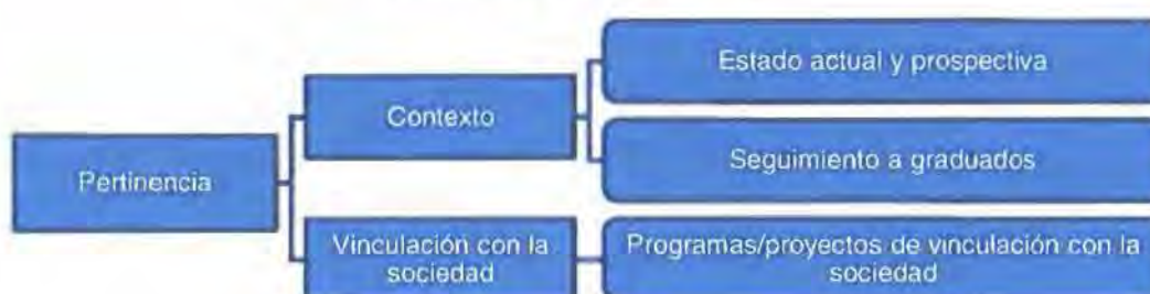
Figura 2: Criterio Pertinencia

Respecto al principio de pertinencia, es fundamental que la oferta de grado considere la planificación nacional y la política pública en educación superior, así como también la normativa relacionada.