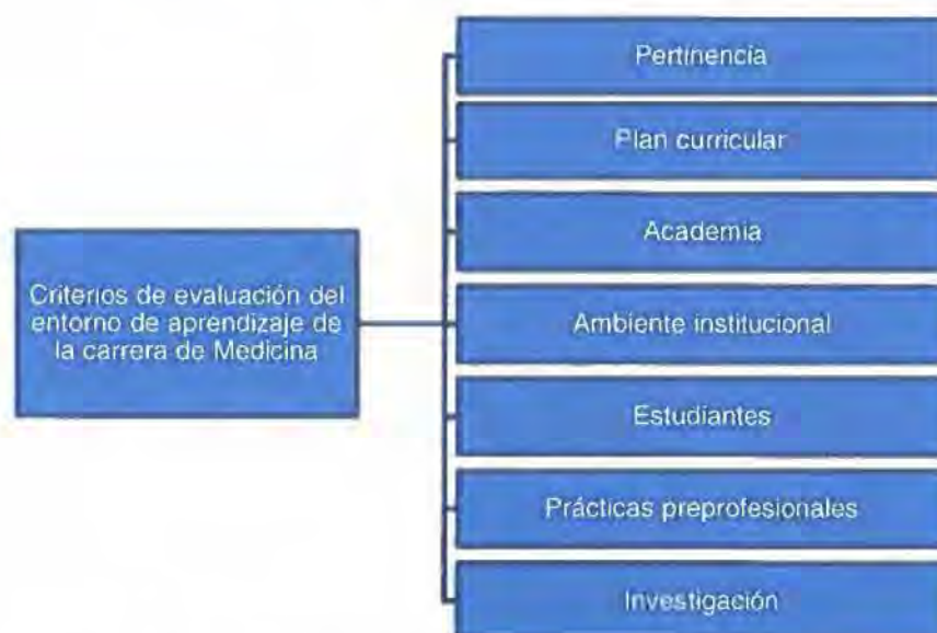
Figura 1: Criterios de evaluación del entorno de aprendizaje de la carrera de Medicina

Los criterios presentados en la Figura 1 contribuyen a entender el concepto de calidad de la educación superior, y a que las carreras trabajen sobre estándares de calidad definidos