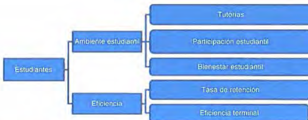
Figura 6: Criterio Estudiantes

Este criterio (Figura 6) considera las condiciones que la institución debe garantizar para influir en el desempeño de sus estudiantes, a través del conjunto de mecanismos y procesos que influyan en el bienestar de los estudiantes en las unidades académicas o carreras. Así también, cuenta con indicadores que miden la eficiencia académica en términos de tasas de desempeño de los estudiantes.