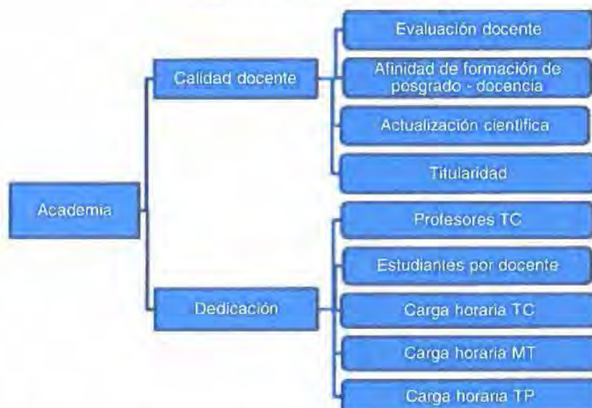
Figura 4: Criterio Academia

El cuerpo académico de la carrera debe tener las competencias necesarias para cubrir todas las áreas curriculares de la carrera, además debe existir el número suficiente de profesores para mantener niveles adecuados de interacción estudiantes y profesores, actividades tutoriales con las y los estudiantes, actividades de servicio a la comunidad, interactuar con los sectores productivos o de servicio y profesionales, así como con los empleadores que conceden prácticas de los estudiantes. Así también, los profesores deben tener cualificaciones apropiadas y deben haber demostrado suficiencia para asegurar una guía adecuada para la carrera, lo que le servirá para desarrollar e implementar procesos