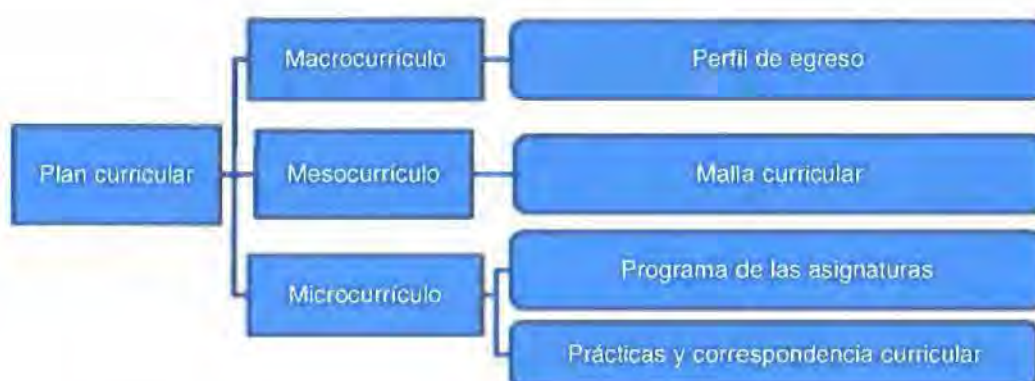
Figura 3: Criterio Plan curricular

En este criterio (Figura 3), se agrupan los estándares relacionados con la evaluación del currículo de una carrera de grado; es decir, la planificación curricular es el instrumento por medio de cual se sustenta la formación académica del estudiante y en donde se engranan, interrelacionan y se constituyen sistémicamente las áreas disciplinares fundamentales y complementarias necesarias para alcanzar los resultados de aprendizaje esperados. En particular, los indicadores utilizados para el efecto corresponden al perfil de egreso del estudiante, el plan de estudios que cursarán en el periodo planteado (malla curricular), la planificación microcurricular el sílabo y la correspondencia de los contenidos planteados en los sílabos, respecto a las actividades de práctica.